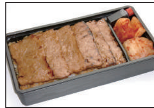
注文番号 007 仙台牛特選カルビ弁当 3,456円(税込) とろける旨味は絶品です