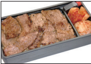
注文番号 005 上ハラミ弁当 2,700円(税込) 肉汁がジューシーで旨さが違います