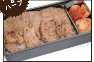
注文番号 004 仙台牛カルビ・ロース弁当 1,836円(税込) カルビとロースの二種盛合せ