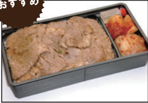
注文番号 001 仙台牛焼肉弁当 1,118円(税込)