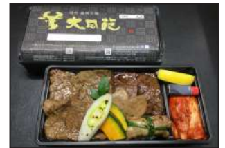
注文番号 008 大同苑特製弁当 3,240円(税込) ネギタン塩・上タン塩・上ハラミ・仙台牛プリスケ 仙台牛ロース5種類のお肉のスペシャル