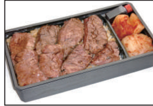
注文番号 003 仙台牛ロース弁当 1,620円(税込) 柔らかい赤身肉です