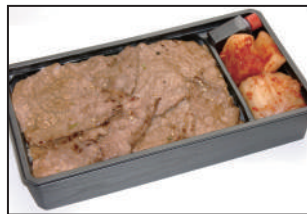
注文番号 006 仙台牛上カルビ弁当 2,700円(税込) 霜降り肉!!格別の旨さです